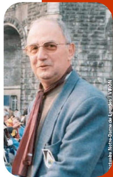
Secretaire Notre-Dame de Lourdes / YRON

met vreugde. Bernadette zei: "Ik ben belast om het u te vertellen, niet eraan te laten geloven." Ik zoek niemand te overtuigen, maar ik wens het gewoon te gaan vertellen... en ik zal het gaan zeggen!